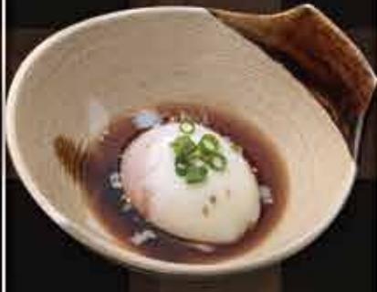
・とろ〜り温玉ダレ