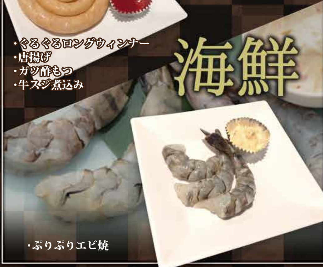
・ぷりぷりエビ焼