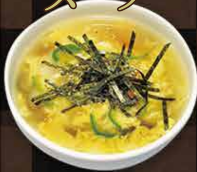
・玉子スープ ・野菜スープ