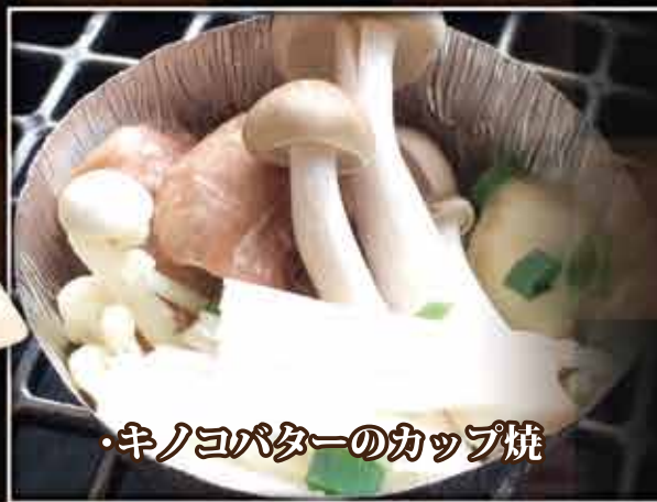
・キノコバターのカップ焼