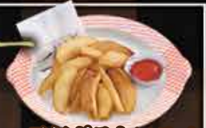
・元気ポテトフライ