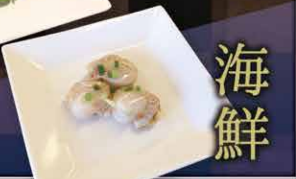
・ベビーホタテ焼 (みそ・しお)