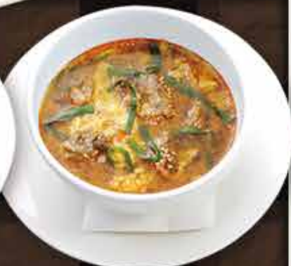
・テグタンスープ🔥