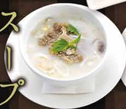
・コムタンスープ