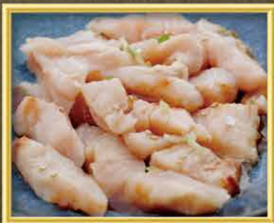
牛ミノ (みそ・しお・にんにく塩・赤辛みそ)

今や焼肉には欠かせない大人気メニューとなりました。 一心亭の牛タンは手切りで少し厚みがあるのが特徴。 塩ダレとレモン汁の相性はまさに、ベストカップル!