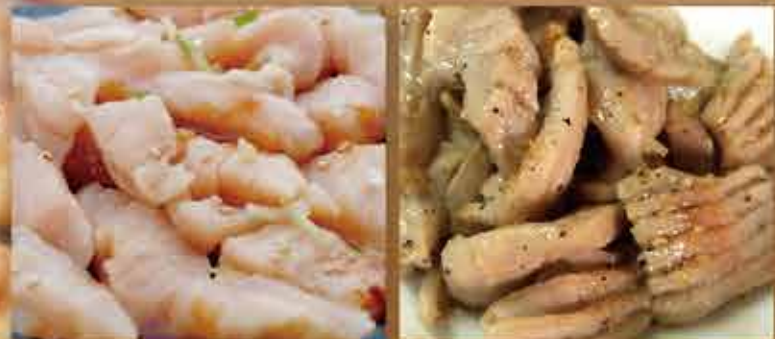
・牛ミノ(みそ・しお・にんにく塩・赤辛みそ) ・豚ガツ(しお)