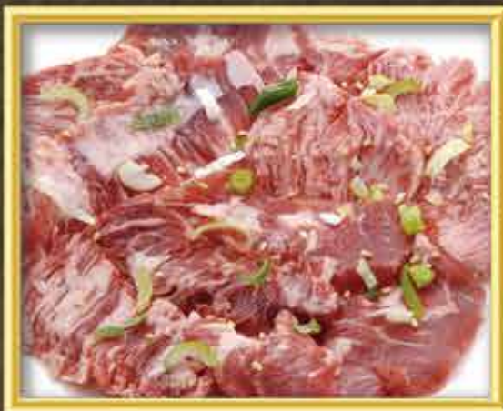
国産牛カルビ (タレ・しお・にんにく塩)

味わい深い霜降りの脂とプリプリの食感が特徴。 ワンランク上のカルビをご堪能あれ。