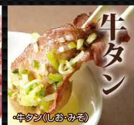
・牛タン(しお・みそ)