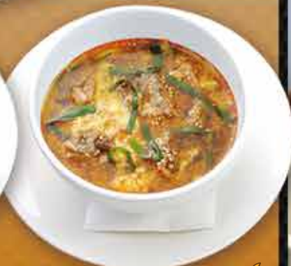
・テグタンスープ🔥