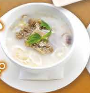
・コムタンスープ