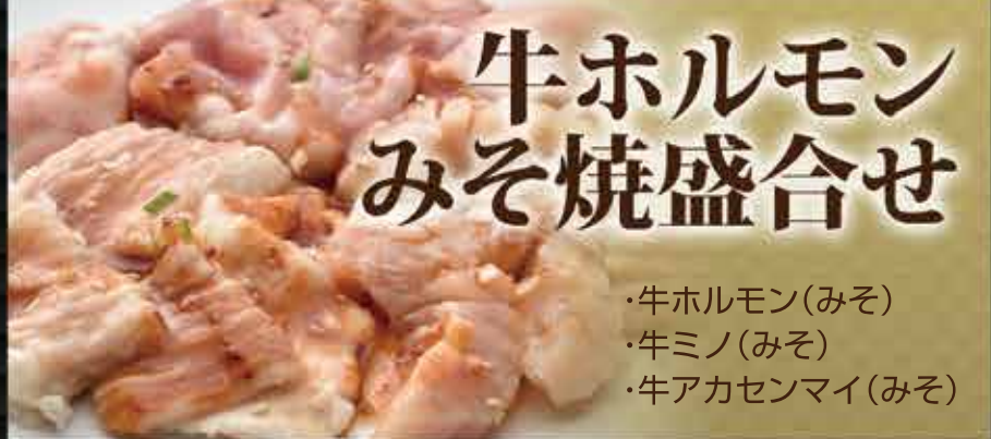
牛ホルモン みそ焼盛合せ