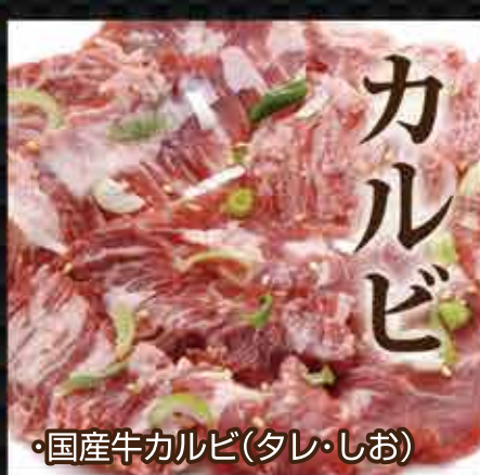
・国産牛カルビ(タレ・しお)